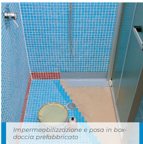
Impermeabilizzazione e posa in box-doccia prefabbricato