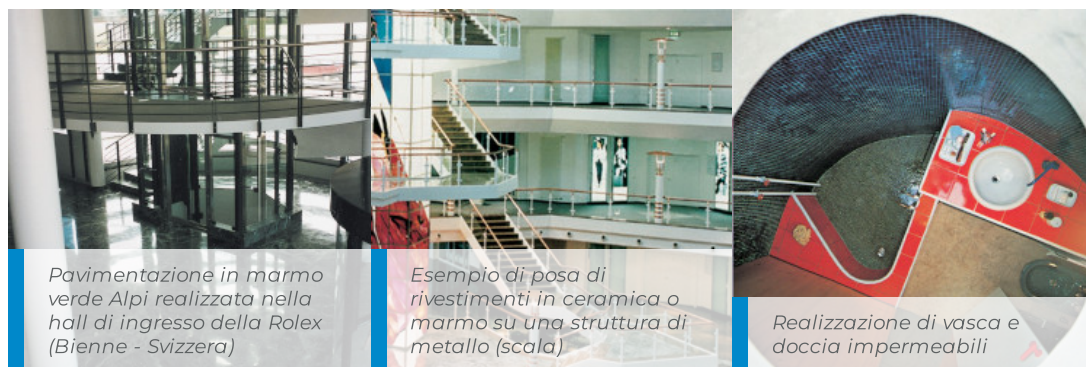
Pavimentazione in marmo verde Alpi realizzata nella hall di ingresso della Rolex (Bienne - Svizzera)