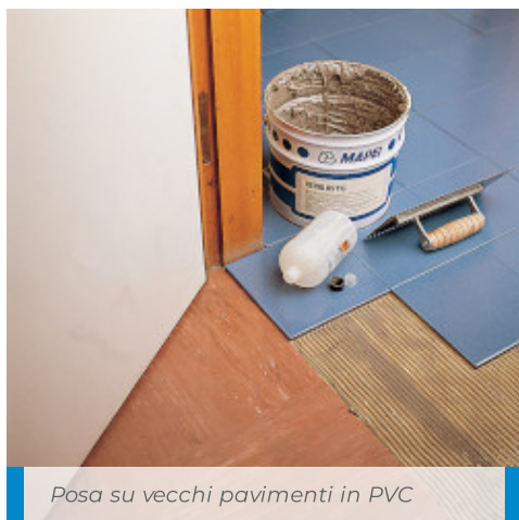
Posa su vecchi pavimenti in PVC